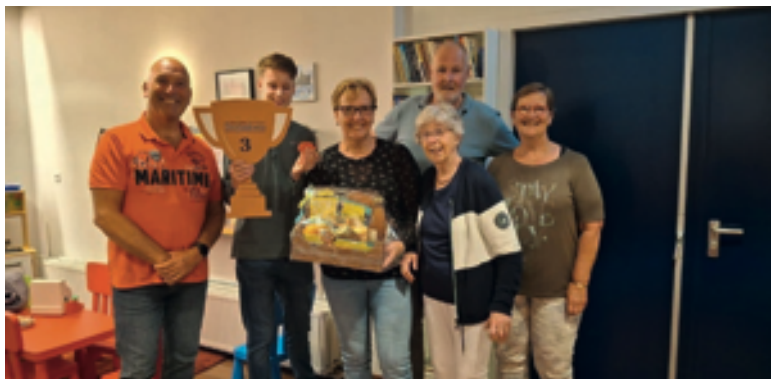
Op de groepsfoto met een deel van het team dat aanwezig was op de vrijwilligersavond