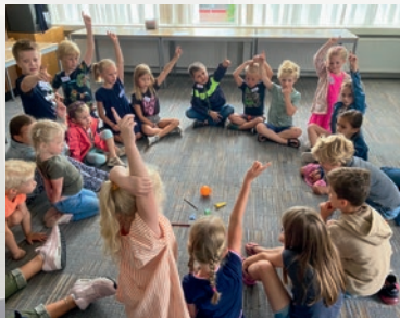
Spelletje binnen gespeeld.