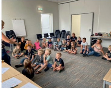
Het verhaal wordt verteld.

Hartelijke groeten, mensen van de Kinderkerk 2.0 en de kindernevendienst